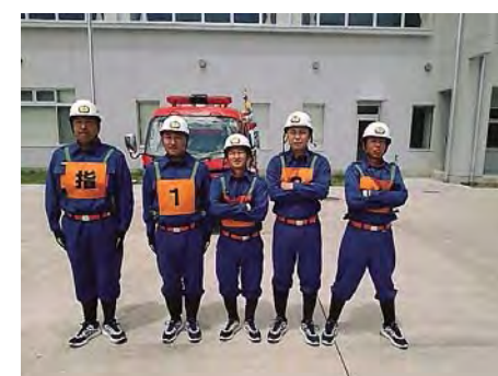
消防団操法大会に出場しました