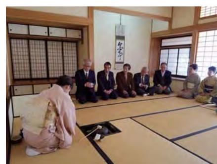
裏千家淡交会山梨青年部 統括幹事から今年は副部長