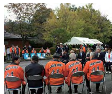
中道地区文化健康ふれあい祭り