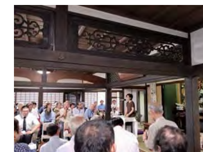
山崎方代 28回忌 鎌倉・瑞泉寺