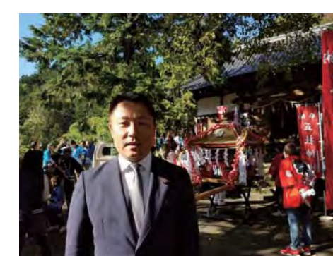
五社神社の例大祭 すぐに着替えてワッショイ