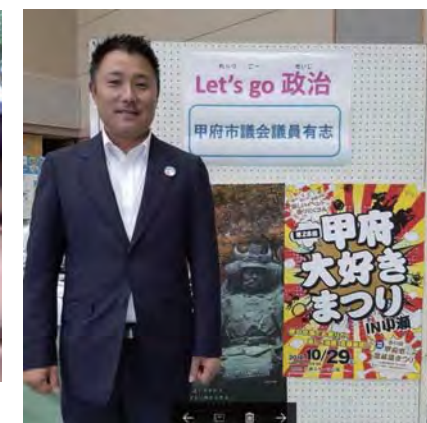
郷育フォーラム 2016 に 市議会一期生でブース出店