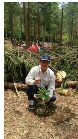
水源林植樹の集い