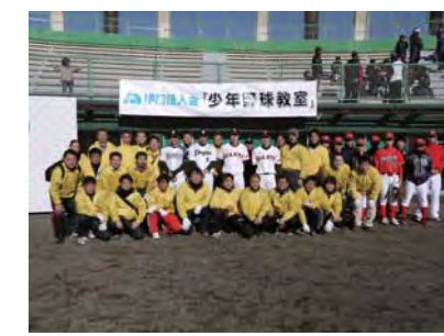
甲府法人会 プロ選手をお招きして 「野球教室・税金教室」 担当委員長でした