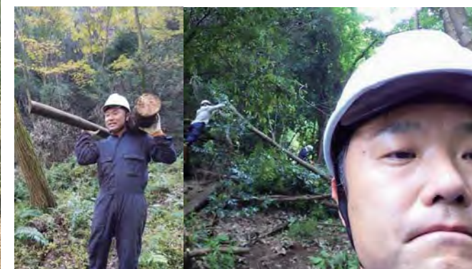
七覚むらづくり協議会で 山林整備・農道整備・そば作り