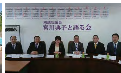
宅建協会会員で構成する山梨県宅建 政治連盟で常任幹事として活動