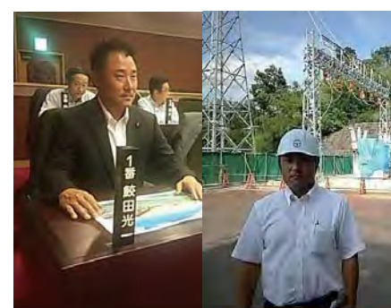
甲府・峡東地域ごみ処理施設 事務組合 議会臨時会・現地視察