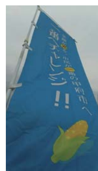
時々辻立をしています ありがとうございます