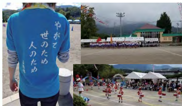
笛南中・中道南小学校・中道保育所 柏保育園の運動会