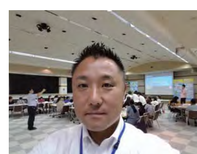
甲府市小中学校 PTA 联合会での活動