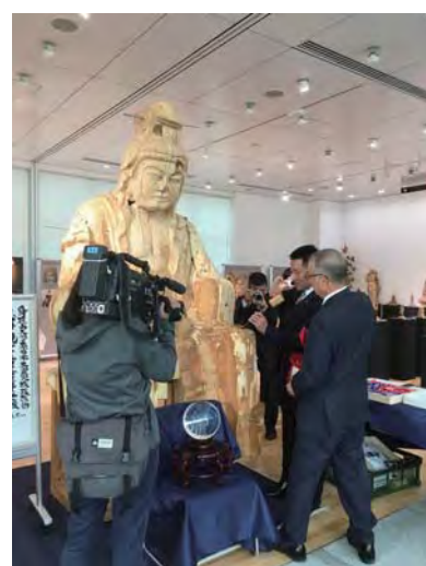
第56回水晶彫刻新作展 仏像制作修復室ノミ入れ